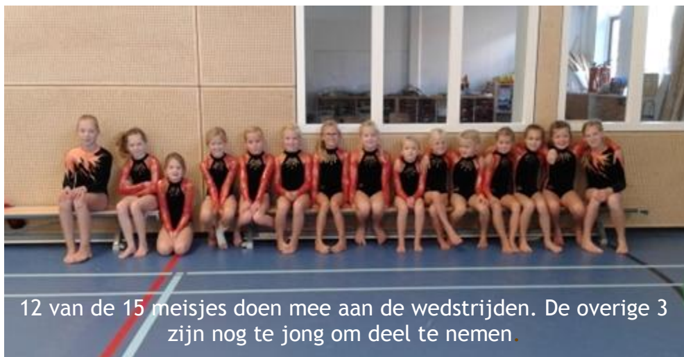
12 van de 15 meisjes doen mee aan de wedstrijden. De overige 3 zijn nog te jong om deel te nemen.